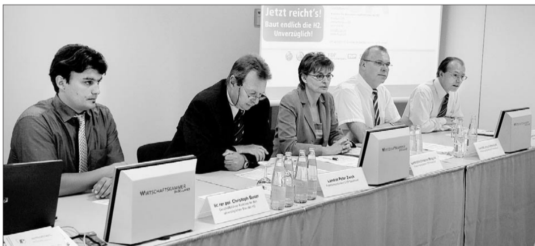
Das bürgerliche «Komitee für den unverzüglichen Bau der H2» will zehn Tage vor der Abstimmung nochmals Wählerinnen und Wähler mobilisieren.