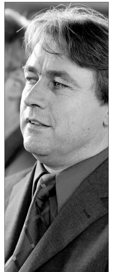
Für Regierungspräsident Urs Wüthrich hat der Bettag als Oase der Besinnung eine besondere Bedeutung.

Der Bettag ist wichtig, weil er nicht so kommerzialisiert ist wie Weihnachten oder Ostern. Diese beiden Feiertage haben mit Besinnung nur noch wenig zu tun. Ich denke, dass die Leute eine Auszeit zu schätzen wissen. Man muss ja nicht in die Kirche gehen, man kann sich auch wieder einmal Zeit nehmen für einen Spaziergang oder ein ausgiebiges Familienzmqorge.