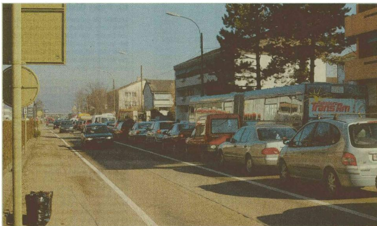
Stauende. Die Verkehrszusammenbrüche auf der Rheinstrasse sollen möglichst bald Geschichte sein.